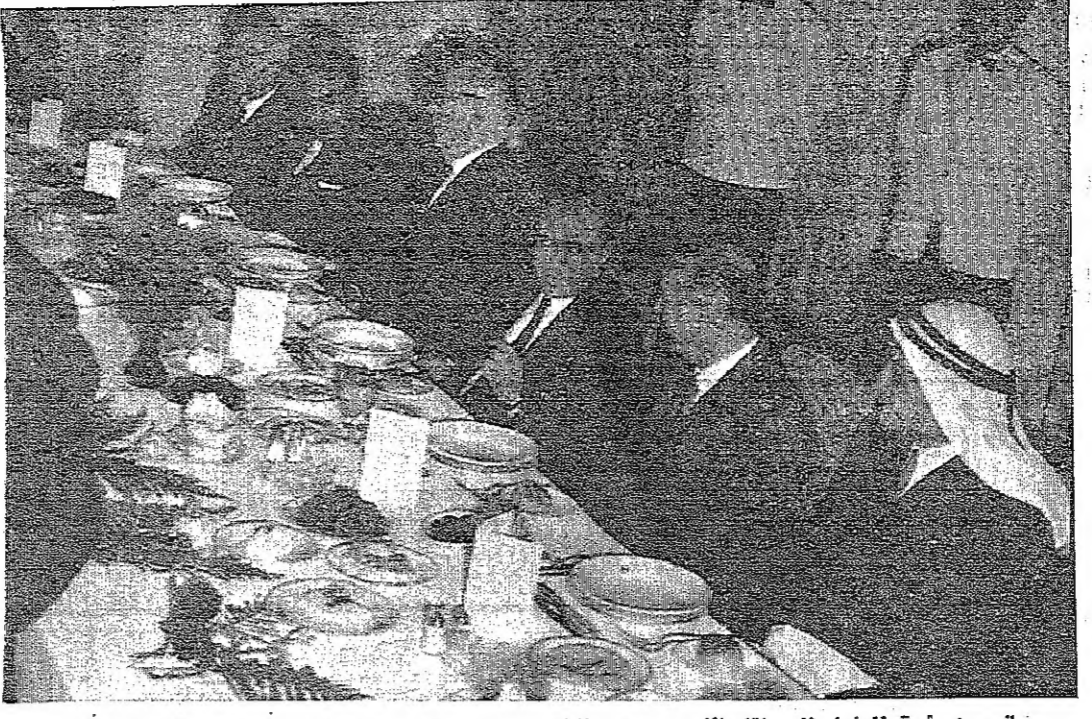
جانب من مائدة المشاء التي اقامها السيد بهجت التلهوني رئيس الوزراء على شرف السيد عبد الحميد الكوش رئيس وزراء ليبيا